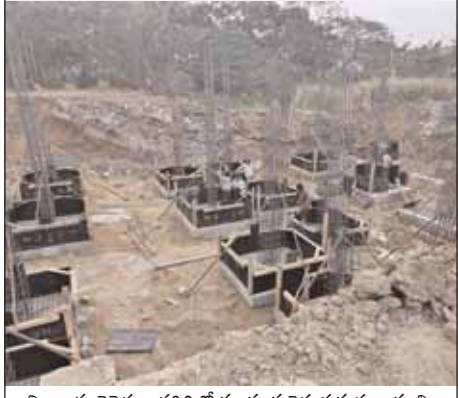
చిల్కూరు రెవెన్యూ పరిధిలో కబ్జాకు గురైన ప్రభుత్వ భూమి