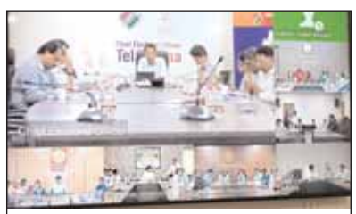
వీడియో కాన్ఫరెన్స్ లో పాల్గొన్న జిల్లా కలెక్టర్, అధికారులు

వికారాబాద్ జిల్లా ప్రతినిధి, మేజర్ న్యూస్ (మార్చి 12): పార్లమెంటు ఎన్నికలకు సంబంధించి భారత ఎన్నికల సంఘం ద్వారా ఏ క్షణంలోనైనా పెడ్యూల్ వెలువడే అవకాశం ఉన్నందున ఎన్నికల నిర్వహణ కోసం అన్ని విధాలుగా సన్నద్ధమై ఉండాలని, ఎన్నికల