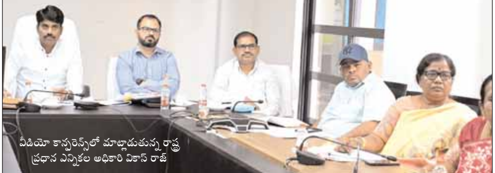
వీడియో కాన్ఫరెన్స్ లో మాట్లాడుతున్న రాష్ట్ర ప్రధాన ఎన్నికల అధికారి వికాస్ రాజ్