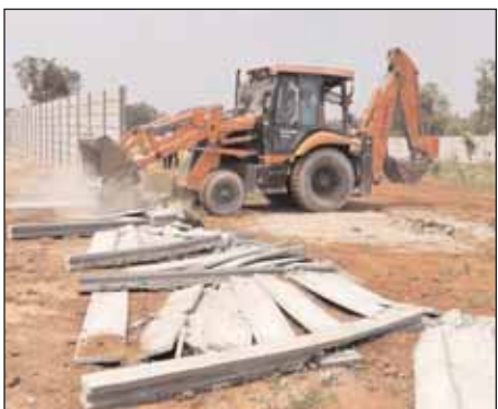
హిమాయత్ నగర్ రెవెన్యూ పరిధిలో నేలమట్టం చేసిన కబ్జా