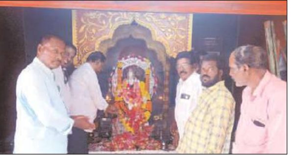
ప్రత్యేక హోమాన్ని కూడా నిర్వహించారు. విచ్చేసిన భక్తులకు అన్న సమారాధన కార్యక్రమాన్ని కూడా నిర్వహించారు.

పూసపాటిరేగ, మార్చి 25, మేజర్స్ న్యూస్: మండలంలోని కుమిలి గ్రామంలో షిరిడీ సాయిబాబా 28వ వార్షికోత్సవ వేడుకలు సోమవారం ఘనంగా జరిగాయి. షిరిడీ సాయిబాబా కు వేకువ జాము నుంచే సాయిబాబాకు పంచామృతాలతో కూడిన అభిషేకాలను నిర్వహించారు. పాలాభిషేకంతోపాటు వివిధ రకాల పళ్ళి రసాలతో సాయిబాబాని అభిషేకాలను నిర్వహించేందుకు భక్తులు పోటీపడ్డారు. భక్తులతో కిటికిలాడిన సాయిబాబాని ప్రాంగణం సాయిబాబాని నామస్మరణతో మార్చిగింది. వార్షికోత్సవంతో పాటు పార్లమి కూడా కలిసి రావడంతో సాయిబాబాని వార్షికోత్సవ వేడుకలకు జిల్లా నలుమూలల నుంచే కాకుండా విశాఖపట్నం పరిసర ప్రాంతాలకు కూడా సాయిబాబాని సన్నిధికి చేరుకొని బాబా సేవలో భక్తులు పాల్గొన్నారు. షిరిడీ సాయిబాబానికి పలు రకాల పుష్పాలంకరణ ఆకట్టుకుంది. లోక శాంతి కళ్యాణార్థం భక్తుల ఆధ్వర్యంలో