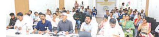
విశాఖపట్నం, మార్చి27, మేజర్ న్యూస్: జిల్లాలో ఇప్పటివరకు పెండింగులో ఉన్న ఫారం - 7, 8 మిగతా 2లో