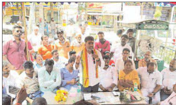
అధ్యక్షులు నారా చంద్రబాబునాయుడు అని కొనియాడారు. బీసీ డిక్టరేషన్ ద్వారా వృద్ధులకు రూ 4000 పెంచిన పెన్షన్ అందజేయడం జరుగుతుందని వివరించారు. బీసీలకు రక్షణ చట్టాన్ని కూడా తీసుకొస్తామని చెప్పారు. వైసీపీ ప్రభుత్వం అధికారంలోకి వచ్చిన తర్వాత 300 మంది బీసీలను దారుణంగా హత్యకు గురికాబడ్డారని తెలిపారు. రాష్ట్రంలో ఎన్టీపీ కూటమి విజయం సాధించడం ఖాయమని నీటి మీడియా చెప్పే అసత్యాలను ప్రజలు నమ్మువద్దని కోరారు. మీరంతా ఆదరించి తనని గెలిపిస్తే మీ ఆశలు నెరవేరే దిశగా కృషి చేస్తానని చెప్పారు. ఈ కార్యక్రమంలో టిడిపి బిజెపి, జనసేన కార్యకర్తలు అభిమానులు పాల్గొన్నారు.