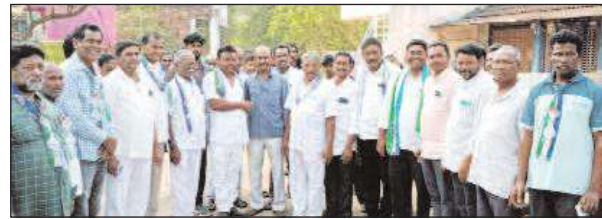
కల్లో ఫ్యాన్ గుర్తుపై ఓటు వేసి తమ బలాన్ని చూపించాలని ఓటర్లను కోరారు. గతంలో వెంకంపేట పంచాయతీ పరిధిలో తాగునీటి సమస్య ఉండేదని ఇప్పుడు అది శాశ్వతంగా పరిష్కరించామని, అలాగే అనేక సీసీ రోడ్లు కాలువలను ఏర్పాటు చేశామని, జరిగిన అభివృద్ధిని చూసి మరోసారి ఎమ్మెల్యేగా తనకు అవకాశం ఇవ్వాలని ఓటర్లను కోరారు. ఈ పర్యటనలో ఆయనతో పాటు పార్టీ నాయకులు కార్యకర్తలు వైయస్సార్ అభిమానులు పాల్గొన్నారు.