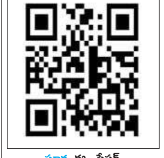
సూర్య ఈ - పేపర్