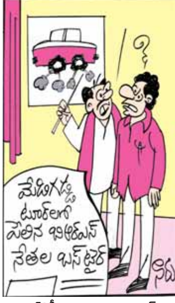
అల్లరి మన కారుకు పంచర్ అయ్యింది. బస్సుకు అయితే మనకు ఎందుకు సార్