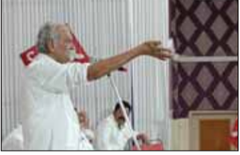
అమరావతి : ఇటీవల కాలంలో విపక్ష నేతలపై ఈడీ, సీబీఐ దాడులు కొనసాగుతున్న నేపథ్యంలో, సీపీఐ జాతీయ కార్యదర్శి కె.నారాయణ బీజేపీ అధినాయకత్వంపై మండి పడ్డారు. బీజేపీ వ్యతిరేక పార్టీలను మోడీ దెబ్బతీస్తు

● బీజేపీ వ్యతిరేక పార్టీలను మోడీ దెబ్బతీస్తున్నారన్న నారాయణ ● ప్రభుత్వమే కనాయిగా మారితే ఎవరికి చెప్పకోవాలంటూ ఆగ్రహం