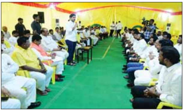
పొత్తుతో మళ్లీ ప్రభంజనం స్థూ నవశకానికి నాంది పలికేలా ఈ నెల 17వ తేదీన చిలకలూరిపేటలో సభ జరగనుందని టీడీపీ జాతీయ ప్రధాన కార్యదర్శి నారా లోకేష్ అన్నారు. రాతియుగం నుండి రాష్ట్రాన్ని స్వర్ణయుగం వైపు నడిపించేందుకే మూడు పార్టీల పాత్తు అని వివరించారు. 2014 ఎన్నికల ఫలితాన్ని తిరగరాసేలా ఏపీలో టీడీపీ, జనసేన, బీజేపీ

తెలంగాణ బ్యూరో, ప్రతినిధి: పొత్తుతో మళ్లీ ప్రభంజనం స్థూ నవశకానికి నాంది పలికేలా ఈ నెల 17వ తేదీన చిలకలూరిపేటలో సభ జరగనుందని టీడీపీ జాతీయ ప్రధాన కార్యదర్శి నారా లోకేష్ అన్నారు. రాతియుగం నుండి రాష్ట్రాన్ని స్వర్ణయుగం వైపు నడిపించేందుకే మూడు పార్టీల పాత్తు అని వివరించారు. 2014 ఎన్నికల ఫలితాన్ని తిరగరాసేలా ఏపీలో టీడీపీ, జనసేన, బీజేపీ