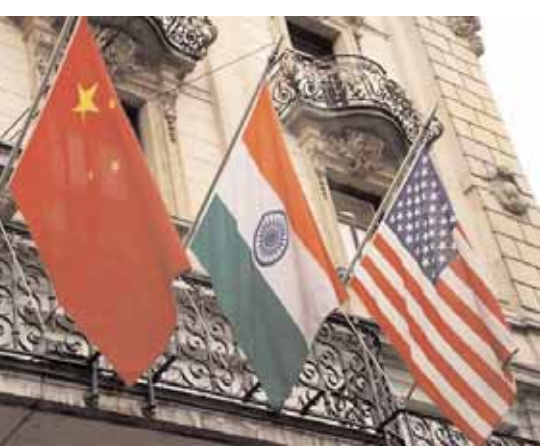
న్యూఢిల్లీ... భారత్-చైనా మధ్య సాయుధ ఘర్షణ జరిగే అవకాశాలున్నాయని అమెరికా నిఘా వర్గాలు హెచ్చరించాయి. ఈమేరకు అమెరికాకు చెందిన డైరెక్ట్ ఆఫ్ సేషన్ల ఇంటెలిజెన్స్

అమెరికా ఇంటెలిజెన్స్ హెచ్చరికలు (డిఎన్ఐఐ) ముప్పు అంచనాల వార్షిక నివేదికను ఇటీవల విడుదల చేసింది. ఇప్పటికే ఇరు దేశాల భారీ సంఖ్యలో దళాలను సరిహద్దులకు తరలించాయని పేర్కొంది. ఇరు దేశాల ద్వైపాక్షిక సంబంధాలు ఇబ్బందికరంగానే ఉంటాయి. సరిహద్దు వివాదం దీనికి ప్రధాన కారణంగా నిలుస్తుంది. 2020 తర్వాత సరిహద్దుల వద్ద చెప్పుకోదగ్గ ఘర్షణలు చోటు చేసుకోలేదు. కానీ, దళాలను మాత్రం భారీగా మోహరించారు. ఇలాంటి సమయంలో చోటుచేసుకోనే అపోహలు, తప్పుడు అంచనాలతో సాయుధ ఘర్షణ ముప్పు పొంచిఉంది అని డీఎన్ఐఐ తన నివేదికలో వెల్లడించింది. డ్రాగన్ సైబర్ ఆపరేషన్లకు కూడా పదునుపెడుతుందని అంచనా వేసింది. 2024 అమెరికా అర్థకృష్ట ఎన్నికల్లో జోక్యం చేసుకోనే అవకాశాలున్నాయని హెచ్చరించింది. 2020 ఘర్షణ తర్వాత సువిచిత్రంగా భారత్-చైనా సరిహద్దుల్లో ఇన్ఫ్రా ప్రాజెక్టులను చాలా దూకుడుగా చేపడుతున్నాయని అమెరికా నివేదికలో పేర్కొన్నారు. ఆరువైపులా