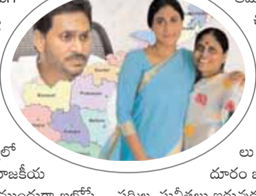
వివేకా భార్య సోభాగ్యమ్మ రంగంలోకి దిగడం దాదాపు ఖరారు