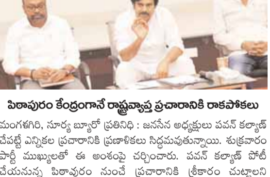
పిరావురం కేంద్రంగానే రాష్ట్రవ్యాప్త ప్రచారానికి రాకపోకలు

మంగళగిరి, సూర్య బ్యారో ప్రతినిధి : జనసేన అధ్యక్షులు పవన్ కల్యాణ్ చేపట్టే ఎన్నికల ప్రచారానికి ప్రణాళికలు సిద్ధంపరుస్తున్నారు. శుక్రవారం పార్టీ ముఖ్యులతో ఈ అంశంపై చర్చించారు. పవన్ కల్యాణ్ పోటీ చేయనున్న పిరావురం నుంచే ప్రచారానికి శ్రీకారం చుట్టాలని