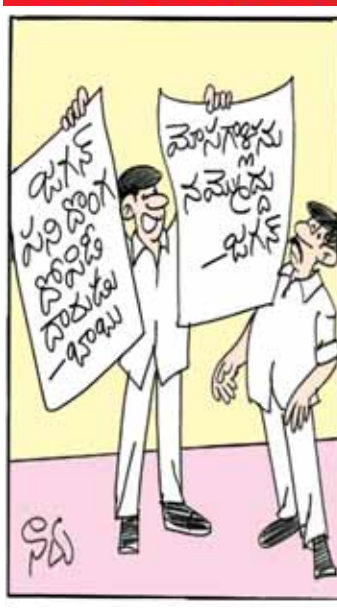
ఆర్జీవీకి చెప్పి ఈ టైటిల్స్ తో సినిమా తీయద్దాం