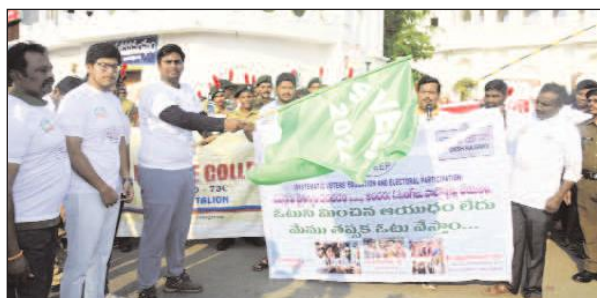
మాట్లాడుతూ మనదేశంలో యువత అధికంగా వున్నారని, ముఖ్యంగా కొత్తగా ఓటరుగా నమోదైన యువత ఓటు విలువ తెలుసుకొని దానిని వినియోగించుకోవడం ద్వారా దేశ ప్రజాస్వామ్య ప్రక్రియలో భాగస్వాములు కావాలన్నారు. ప్రపంచంలోనే అతి పెద్ద ప్రజాస్వామ్య దేశమైన భారత్ లో సార్వత్రిక ఎన్నికలు ఒక పెద్ద పండుగ వంటివని, ఇందులో ప్రతిఒక్కరూ పాల్గొనాల్సి వుందన్నారు. అందరి భాగస్వామ్యంతోనే ప్రజాస్వామ్యం పరిపుష్టమవుతుందన్నారు.