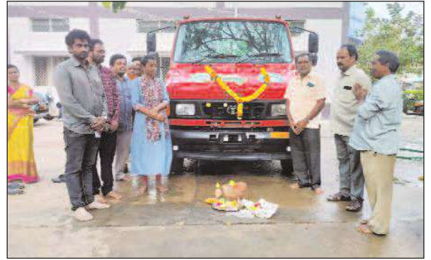
ఆంధ్రప్రదేశ్ కార్యక్రమంలో భాగంగా ఇటీవల బొబ్బిలి పురపాలక సంఘానికి మంజూరు కాబడిన సెప్టిక్ క్లీన్ వాహనాన్ని ప్రారంభించారు.