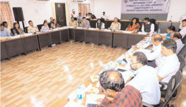
ప్రవర్తన నియమావళి పక్కాగా అమలు చేస్తూ ఉల్లంఘన జరగకుండా చూడాలన్నారు. నేటి నుండి ఎఫ్ ఎన్ టి ఎన్ ఎన్ టి బృందాలు , చెక్ పోస్ట్ లు పనిచేయాలన్నారు.