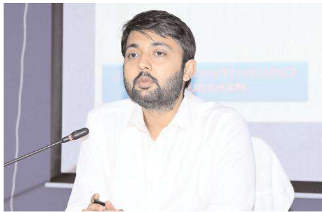
సమ్మర్ యాక్షన్ ప్లాన్