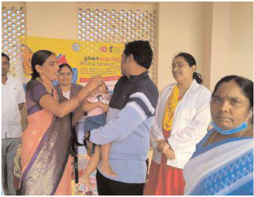
చిన్నారులకు రెండు చుక్కలతో ఆరోగ్యవంతం పోలియో రహిత దేశంగా భారత్