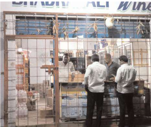
మేరకు కాలం చెల్లిన బీర్ల పై విచారణ జరుపుతున్నామని విచారణ జరిపి తగు చర్యలు తీసుకుంటామని ఆయన తెలిపారు.