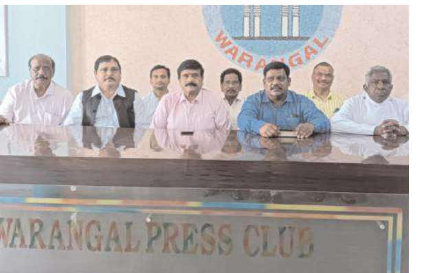
ఎన్నికల్లో వరంగల్ పార్లమెంట్ అసెంబ్లీ స్థానాలల్లో దళిత క్రిస్టియన్స్ ఓట్లు