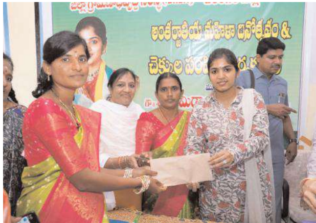
అక్షల బ్యాంకు లింకేజీ రుణాలను చెక్కులను మహిళా సంఘాలకు అందజేశారు మహిళలు పొందుపుగా డబ్బులను వాడుతారని ఇల్లు చక్కబెడతారని కితాబులు ఇచ్చారు.