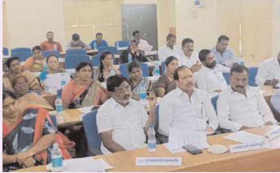
ముదటి పేజీ తరువాయి..