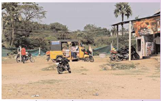
ఉండవలసిన కనీస సౌకర్యాలు లేకున్నా వైన్ షాపులు నడిపిస్తుంటే ఎక్సైజ్ అధికారులు ఎంచేస్తున్నారు. ఎక్సైజ్ సిబ్బంది పట్టించుకుంటారా లేదా జిల్లా అధికారులు పట్టించు కుంటారా వేచి చూడాలి.

పట్టించుకొని ఎక్సైజ్ అధికారులు ఫుల్ బాటిలకు అదనంగా 60, బీరు 10. అసలు పర్మిట్ సౌకర్యం ఉందా లేదా? ప్రభుత్వం చెప్పింది ఏంటి బ్రాండ్ షాప్లలో జరిగేది ఏంటి? చూసి చూడనట్టు వదిలేస్తున్న ఎక్సైజ్ అధికారులు ఖానాపూర్ మర్చి 06, సూర్య న్యూస్ : ఖానాపూర్ మండలంలోని ఖానాపూర్ రెండు వైన్ షాప్ లు, అశోక్ నగర్ లో ఒకటి, పాఖాల వైన్ బ్రాండ్ షాప్ పేరు అశోక్ నగర్ ది కాని షాపు అయోద్య నగర్ లో ఉంది. అది ఏక్కడ స్థలం అని అధికారులు క్షుణ్ణంగా పరిశీలించాలి. అలాగే వైన్ షాప్ లకు కనీస సౌకర్యాలు లేకున్నా ఎక్సైజ్ అధికారులు ఎందుకు పట్టించుకోవడం లేదు. వైన్ షాపులలో ఫుల్ బాటిల్ కు అదనంగా 60 రూపాయలు ఒక బీరు కు అదనంగా 10 రూపాయలు, గ్లాసులకు 10 రూపాయలు మంచినీరుకు 10 రూపాయలు అదనంగా తీసుకొని మందుబాబులు జేబులు చిల్లు కొడుతున్నారు. ఇవే కాకుండా మందు బాటిలకు స్టిక్కర్లు వేసి బెల్ట్ షాపుల వారి దగ్గర అదనపు చార్జీలు వేస్తున్నారు. ఒక వైన్ షాపుకు ప్రభుత్వ నియమ నిబంధన ప్రకారం