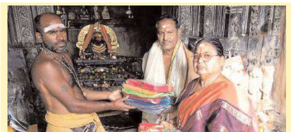
కోట గుళ్ళు గణపేశ్వరుడికి రూ.30 వేలతో పట్టు వస్త్రాల బహూకరణ

నుంచి వెళ్లిన వారితో సప్తమేమీ లేదన్నారు. పార్టీ నుంచి ఎందుకు వెళ్లామా అని.. వారు కూడా తమ తప్పును గుర్తించే రోజు దగ్గరలోనే ఉందన్నారు. పార్టీ శ్రేణులు అధైర్యపడవద్దని, పార్టీ కోసం పని చేసే కార్యకర్తలను కడుపులో పెట్టుకొని చూసుకుంటానని అన్నారు. బి.ఆర్.ఎస్. పార్టీ నాయకులను, కార్యకర్తలను బెదిరింపులకు పాల్పడుతూ పార్టీ మారాలని చేస్తున్న బలవంతపు చర్యలు మానుకోవాలని హెచ్చరించారు. కాంగ్రెస్ ప్రభుత్వం ఆచరణకు సాధ్యంకాని హామీలు ఇచ్చి అబద్ధాల పునాదులపై అధికారంలోకి వచ్చిందని మండిపడ్డారు. కాంగ్రెస్ ప్రభుత్వం అధికారంలోకి వచ్చిన మూడు నెలల్లోనే ప్రజలు ఇబ్బందులు ఎదుర్కొంటున్నారని, లోకపబ్ ఎన్నికల్లో బి.ఆర్.ఎస్. పట్టం కట్టేందుకు సిద్ధంగా ఉన్నారన్నారు.