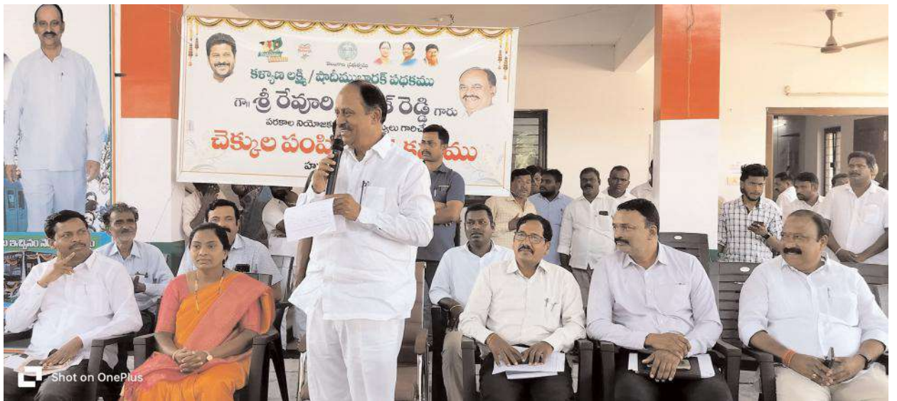
అందించేలా కృషి చేస్తున్నారని తెలిపారు. కార్యక్రమంలో అధికారులు, కాంగ్రెస్ నాయకులు పాల్గొన్నారు.

పరకాల, మార్చి 07, సూర్య న్యూస్: కళ్యాణ లక్ష్మి, షాదీ ముబారక్ పథకం పేదలకు వరమని పరకాల ఎమ్మెల్యే రేవూరి ప్రకాశ్ రెడ్డి అన్నారు. గురువారం పరకాల ఎమ్మెల్యే క్యాంపు కార్యాలయంలో పరకాల పట్టణం, పరకాల, దామెర, నడికూడా, ఆత్మకూరు మండలాల పరిధి లోని 69 మంది లబ్ధిదారులకు కళ్యాణ లక్ష్మి, షాదీ ముబారక్ చెక్కులను ఎమ్మెల్యే రేవూరి లబ్ధిదారులకు అందించారు. ఈ సందర్భంగా ఆయన మాట్లాడుతూ రాజీయే రోజులలో పెళ్లయిన వెంటనే లక్ష 116 రూపాయల చెక్కుతో పాటు తులం బంగారం కాంగ్రెస్ ప్రజా ప్రభుత్వం లబ్ధిదారులకు అంద చేయడం జరుగుతుందన్నారు. కాంగ్రెస్ ప్రభుత్వం ఎప్పుడు పేదల పక్షాన పని చేస్తుందని చెప్పారు. గత ప్రభుత్వంలో ఉన్న పథకాలను కూడా కొనసాగిస్తూ లబ్ధిదారులకు ఎలాంటి ఇబ్బంది కలగకుండా పాలన కొనసాగిస్తున్నామని తెలిపారు. రాష్ట్రం ఆర్థికంగా ఇబ్బందుల్లో ఉన్న సీఎం రేపంత్రిడ్డి గత ప్రభుత్వంలో పెండింగ్లో ఉన్న కళ్యాణ లక్ష్మి, షాదీ ముబారక్ ల బ్ధిదారుల చెక్కులను ఇవ్వడం జరుగుతుందని వెంట వెంటనే ఆర్డీలు, తహశీల్దార్లు