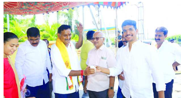
గెలుపు ఖాయం అయిపోయింది. అయితే మీరందరూ మే 13వ తేదీ తప్పకుండా ఓటు వేయాలని, ఆ తర్వాతే సమ్మర్ వెకేషన్

విజయవాడ , మేజర్ న్యూస్: రాష్ట్రంలోనే కాదు, దేశవ్యాప్తంగా ఎన్నియే వైబ్రేషన్ కనిపిస్తుంది. మూడోసారి మోదీ ప్రధాన మంత్రి కాబోతున్నారు. అలాగే చంద్రబాబు నాయుడు ముఖ్యమంత్రి కాబోతున్నారు. ఎన్నియే కూటమి