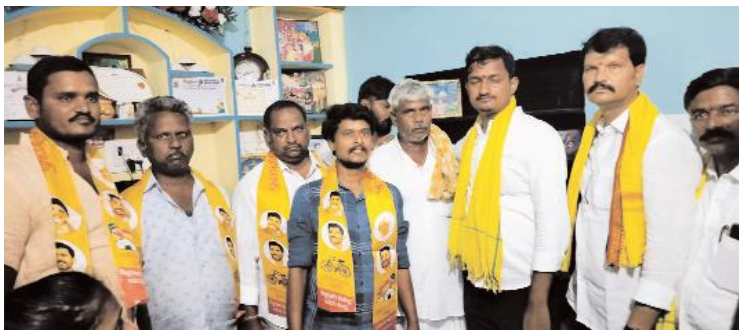
ప్రచారంలో టిడిపి నాయకులు