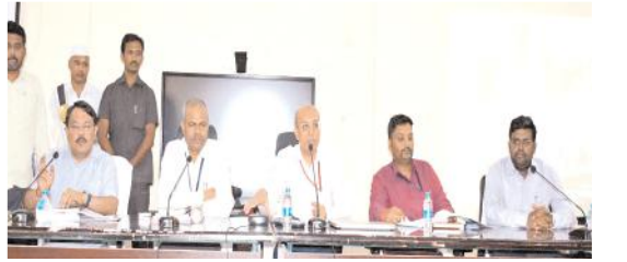
మాట్లాడుతున్న ఎన్నికల పరిశీలకులు

- ఎన్నికల బరిలో ఉన్న అభ్యర్థులు, ప్రతినిధులతో సమన్వయ సమావేశంలో ఎన్నికల పరిశీలకులు