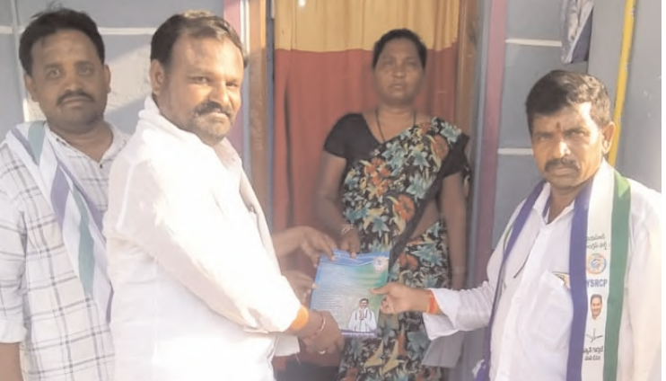
కరపత్రాలను ఇచ్చి ఓటు వేయాలని అడుగుతున్న నాయకులు