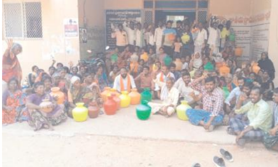
ఎంపీడీవో కార్యాలయం మందు ఖాళీ బండలతో ధర్మా నిర్వహిస్తున్న కుటుంబ మహిళలు గోనెగండ్ల మేజర్ న్యూస్ : ఆరు మాసాలూగా మా గ్రామంలో తాగునీటి సమస్య తీవ్రంగా ఉంది. పలు మార్లు అధికారులకు సమస్యను విన్నవించినప్పటికీ సమస్య పరిష్కారం కాలేదు. చేసేంది లేక

ఎంపీడీవో కార్యాలయం ఎదుట ఖాళీ బండలతో ధర్మా