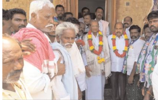
ఎర్రకోట సమక్షంలో బివి అనుచరులు

ఎమ్మిగనూరు ప్రతినిధి, మేజర్ న్యూస్ ఎన్నికల వేళ కోరి కోరి తెచ్చుకోవడం అంటే ఇలానే ఉంటుంది .. ఏదో వయస్సు మీద పడింది.. ఓ మూలన ఉంటారు ఎవరేమన్న పట్టించుకోరు అనుకుంటే తెలుగుతమ్ముళ్ళ ఆపద్ధవు ప్రచారంతో ఎర్రకోట కన్నెర్ర చేశారు.. వైకాపాలో ఉన్న చెన్నకేవపడి బుజానా జగన్ను బుట్టా గెలుపు బాధ్యత పెట్టిన విషయం విధితమే అయినప్పటికీ ఎర్రకోట చెన్నకేవపడి బివి గెలుపుకు సహకారం అందిస్తున్నారని ఇందులో బాగాగా ఆయన ఇలాకాలోని నేతలు బివి కూటమిలో చేరుతున్నారనే దుప్రచారం అందుకోవడంతో 56 ఏళ్ల రాజకీయంతో తన చతురతను చూపిన నేతదగ్గర కుప్పిగంతులు వెయ్యడంతో తన అడ్డాలో ఉన్న ప్రతి పల్లెలో మకాం వేసి జగన్ను ఆశయ సాధనలో మనందరం బుట్టారేణుకమ్మను