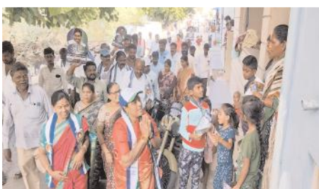
ఇంటింటికెళ్లి ప్రచారం నిర్వహిస్తున్న ఎమ్మెల్యే