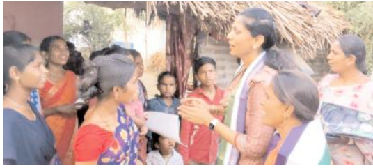
వైసీపీ మ్యానిఫెస్టోను వివరిస్తున్న శిల్పారెడ్డి