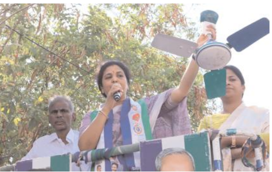
రోడ్డుపోలో బుట్టారేణుక ఫ్యాన్ గుర్తు చూపుతున్న దృశ్యం