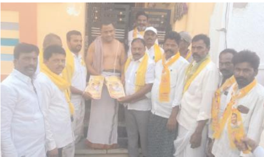
సూపర్ 6 కరపత్రాలను పంపిణీ చేస్తున్న దృశ్యం