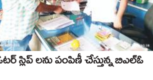
ఓటర్ స్లిప్ లను పంపిణీ చేస్తున్న బిఎల్ఓ

చాగలమర్రి, మేజర్ న్యూస్ : మండలంలోని వివిధ గ్రామాలలో పాటు పట్టణంలో ఓటరు స్లిప్పులు పంపిణీ కార్యక్రమాన్ని సోమవారం చేపట్టారు. పట్టణంలోని వార్డుల్లో బూతుల వారిగా తిరిగి ఓటరు స్లిప్పులను పంపిణీ చేశారు. సార్వత్రిక ఎన్నికల్లో వారివారి వారి ఓటు హక్కును వినియోగించుకునేందుకు స్లిప్పులను పంపిణీ చేసినట్లు బిఎల్ ఓటు తెలియజేశారు.