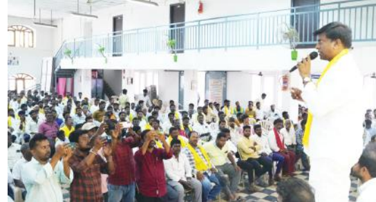
యువతను స్త్రీలతో మాట్లాడుతున్న బీవీ జయనాగేశ్వరరెడ్డి