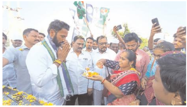
ఎమ్మెల్యేకు హాటలుతుస్తున్న మహిళలు