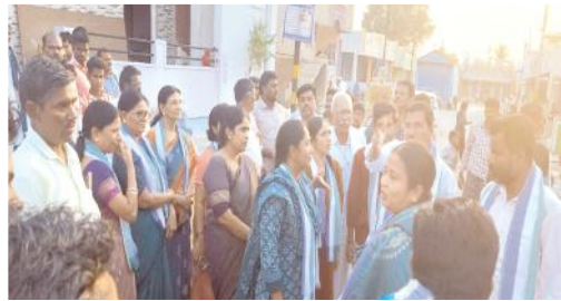
ప్రచారంలో ఓటర్లను అభ్యర్థిస్తున్న ఎమ్మెల్యే కుమార్తె, కోడలు

- మంత్రాలయం నియోజకవర్గ అభివృద్ధి వైసీపీ హయాంలోనే సాధ్యపడింది - ఎమ్మెల్యే కుమార్తె, కోడలు