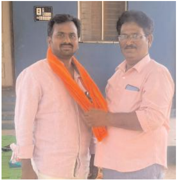
ఎంపీఆర్పీఎస్ కందువా కప్పుతున్న దృశ్యం