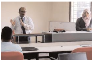
చాట్ జిపిటి గురించి వివరిస్తున్న దృశ్యం