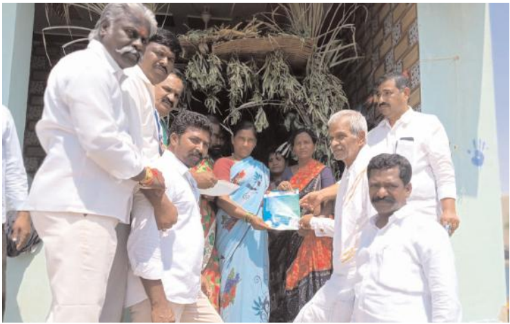
పథకాల గురించి వివరిస్తున్న వైకాపా నాయకులు