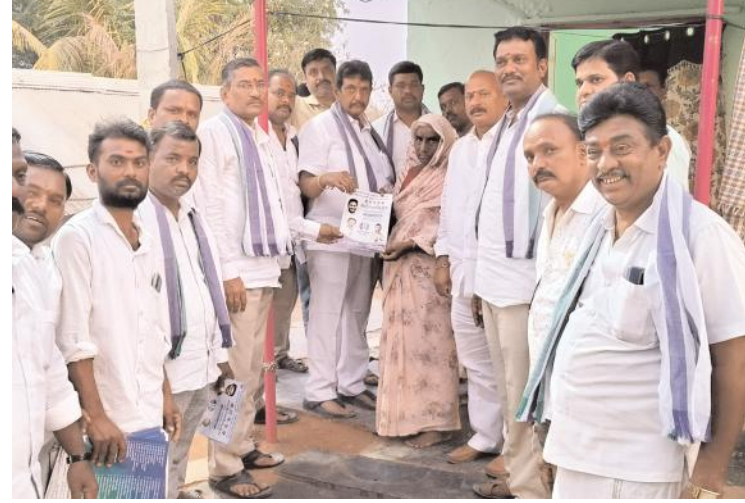
ఇంటింటి ప్రచారం నిర్వహిస్తున్న వైసీపీ నాయకులు