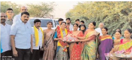
బీసీ ఇందిరమ్మకు స్వాగతం పలుకుతున్న మహిళలు