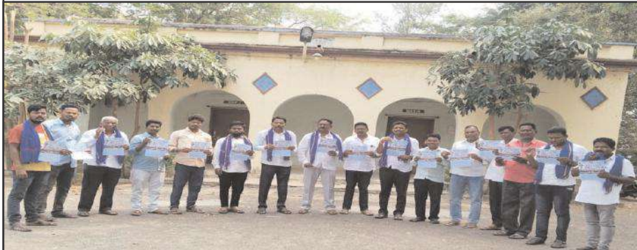
లక్ష్మణ్ణిపేట, 03ఏప్రిల్, సూర్య మేజర్ న్యూస్