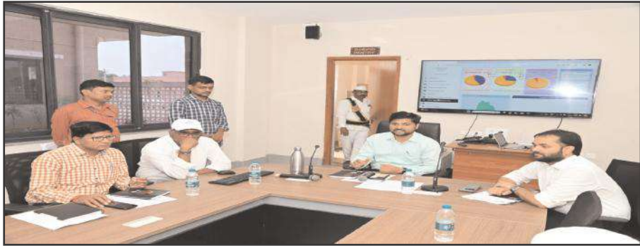
ఆసిఫాబాద్ ప్రతినిధి 3 ఏప్రిల్ సూర్య మేజర్ న్యూస్