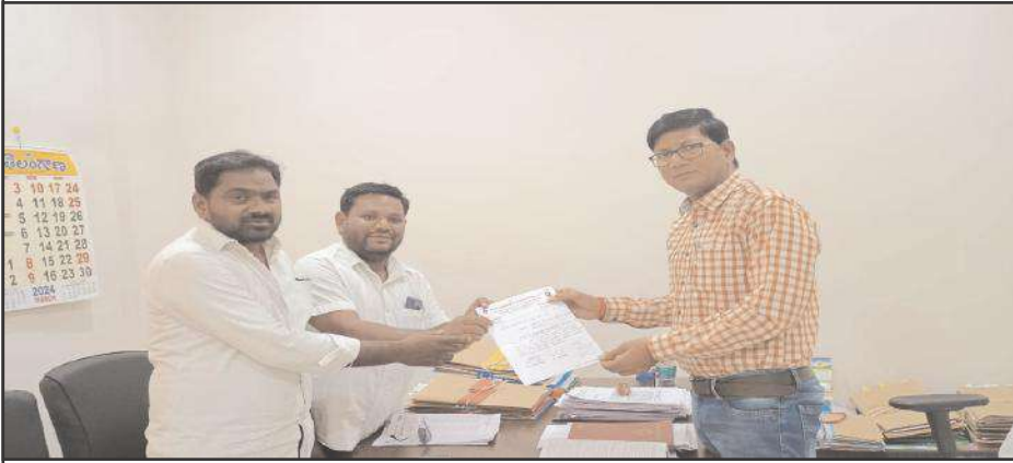
ఆసిఫాబాద్, 03ఏప్రిల్, సూర్య మేజర్ న్యూస్

కుమరం భీం ఆసిఫాబాద్ జిల్లా వ్యాప్తంగా 2023 24 సంవత్సరంలో పెళ్లిళ్లు చేసుకున్న వారు ప్రభుత్వ పథకమైన కల్యాణ లక్ష్మికి దరఖాస్తు చేసుకున్నారు దరఖాస్తు చేసుకున్న నేటికి కల్యాణ లక్ష్మి డబ్బులు రాలేదు దీని వలన లబ్ధిదారులు ఇబ్బందులు పడుతున్నారని డివైఎఫ్ఐ కెవిఎస్ ఆధ్వర్యంలో జిల్లా డిఆర్ఓ లోకేశ్వర్ కు వినతి పత్రం ఇవ్వడం జరిగింది, ఈ సందర్భంగా మాట్లాడుతూ జిల్లాలో పెళ్లిళ్లు చేసుకుని లబ్ధిదారులు కల్యాణ లక్ష్మి కోసం దరఖాస్తు చేసుకున్నారు, నేటికి కల్యాణ లక్ష్మి చెక్కులు రాక లబ్ధిదారులు తీవ్ర ఇబ్బందులు పడుతున్నారు ప్రభుత్వం ఇస్తున్న పథకం కల్యాణ లక్ష్మి వస్తదని పేరుతో బయట వడ్డీలకు తీసుకొని పెళ్లిళ్లు చేశారు నేటికి అవి రాకపోవడంతో వడ్డీలు కట్టలేక ఇబ్బందులు పడుతున్నారు ఎమ్మార్వో ఆర్డీవో ఎమ్మెల్యే ట్రెజరీ వద్ద కల్యాణ లక్ష్మి ఆవైస్ పూర్తి అయిన ప్రభుత్వం బ్యాంకులలో డిపాజిట్ అయినా అది ఇప్పటివరకు చెక్కు రూపంలో లబ్ధిదారులకు అందలేదు పెండింగ్ లో ఉన్నటువంటి కల్యాణ లక్ష్మి చెక్కులను లబ్ధిదారులకు అందజేయాలన్నారు.