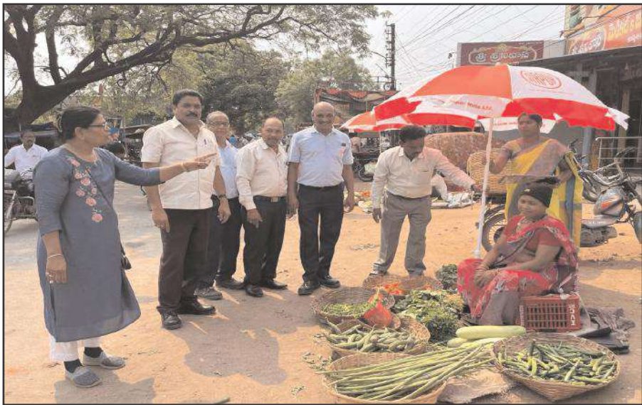
కాగజ్ నగర్, ఏప్రిల్ 3, సూర్య మేజర్ న్యూస్: