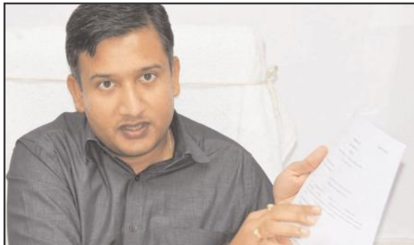
ఆదిలాబాద్ ఏప్రిల్ 04 సూర్య మేజర్ న్యూస్

- పోస్టల్ బ్యాలెట్ కోసం ఏప్రిల్ 15 లోగా ఉద్యోగుల వివరాలతో కూడిన దరఖాస్తు సమర్పించాలి - సంబంధిత శాఖల నోడల్ అధికారులు దరఖాస్తు ఫారం పై సంతకం - లేటెస్ట్ ఏపీఐ కార్డ్ వివరాలతో సమర్పించాలి - అదిలాబాద్ పార్లమెంట్ లిటర్చింగ్ అధికారి, జిల్లా కలెక్టర్ రాజ్మొషా