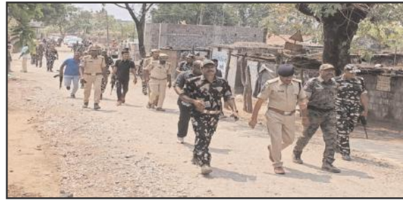
వాంకిడి, మార్చి 4, సూర్య మేజర్ న్యూస్,