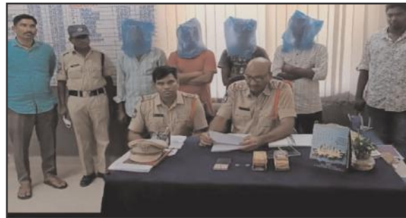
నెన్నెల, ఏప్రిల్ 4