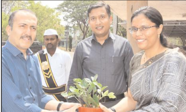
అదిలాబాద్ ఏప్రిల్ 04 సూర్య మేజర్ న్యూస్