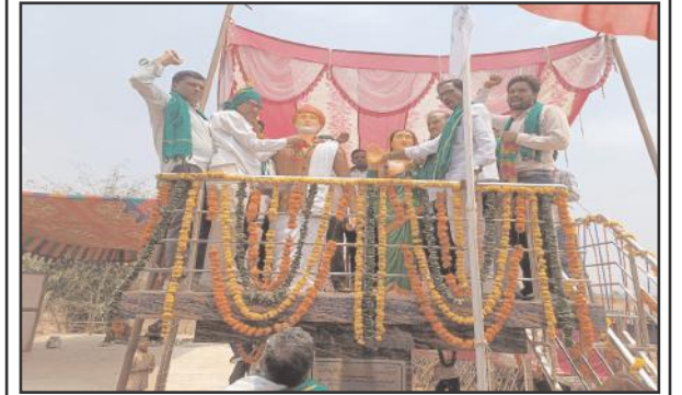
వాంకిడి, మార్చి 4, సూర్య మేజర్ న్యూస్,