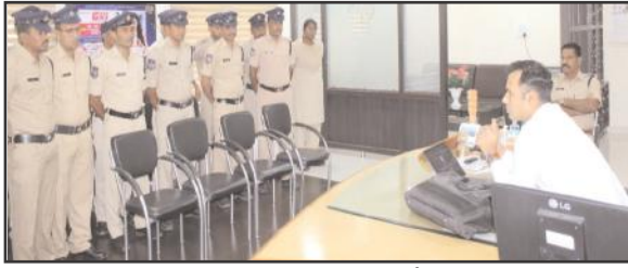
ఆదిలాబాద్ ఏప్రిల్ 04 సూర్య మేజర్ న్యూస్

- ప్రతి పోలీస్ స్టేషన్ కు ఒక సైబర్ వాలయర్