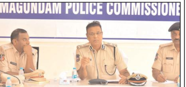
మంచుర్యాల ప్రతినిధి, ఏప్రిల్ 04, సూర్య మేజర్ న్యూస్