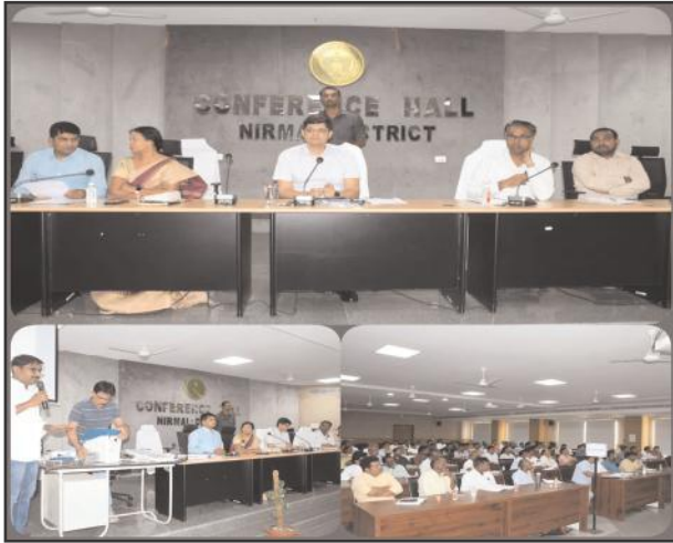
నిర్మల్ ప్రతినిధి ఏప్రిల్ 26, సూర్య మేజర్ న్యూస్