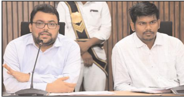
మంచీర్యాల ప్రతినిధి, ఏప్రిల్ 26, సూర్య మేజర్ న్యూస్ :