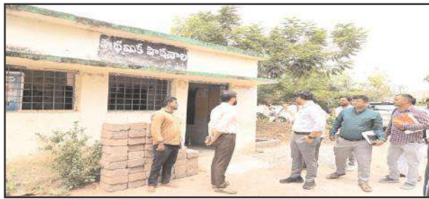
రెబ్బెన, 29 ఏప్రిల్ సూర్య మేజర్ న్యూస్