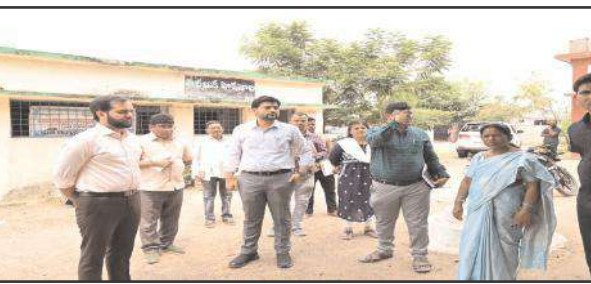
కాగజ్ నగర్, 29 ఏప్రిల్ సూర్య మేజర్ న్యూస్

కాగజ్ నగర్ పట్టణంలోని సంజీవయ్య కాలనీలో గల ప్రభుత్వ ప్రాథమిక పాఠశాల (హరిజన వాడ), మండలంలోని జంబుగ గ్రామంలో గల మండల పరిషత్ ప్రాథమిక పాఠశాల లను బుధవారం ఉదయం కుమరం భీం అసిఫాబాద్ జిల్లా కలెక్టర్ వెంకటేష్ దోత్రే స్థానిక అధికారులతో కలిసి సందర్శించారు. అమ్మ ఆదర్శ పాఠశాల కమిటీల ఆధ్వర్యంలో ఆయా పాఠశాలల్లో కనీస సౌకర్యాల కల్పన కోసం చేపడుతున్న పనులను ఆయన పరిశీలించారు. పనులను నాణ్యత తో నిర్ధారించిన గడువు లోగా పూర్తి చేయాలని ఆయన టీఎస్ ఈడబ్ల్యు ఐడిఎస్ ఏఐ శరత్ ను ఆదేశించారు. ఇంజనీరింగ్ అధికారులకు పలు సూచనలు చేశారు. అనంతరం పార్లమెంట్ ఎన్నికల నేపథ్యంలో ఆయా పాఠశాలల్లో ఉన్న పోలింగ్ స్టేషన్లను పరిశీలించారు. ఈ కార్యక్రమంలో జిల్లా కలెక్టర్ తో పాటు రెవెన్యూ, మున్సిపల్, విద్యశాలకు చెందిన అధికారులు, సిబ్బంది పాల్గొన్నారు.