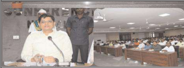
నిర్మల్ ఏప్రిల్ 6, సూర్య మేజర్ న్యూస్