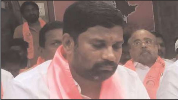
ఆదిలాబాదు ఉమ్మడి జిల్లా ప్రతినిధి, ఏప్రిల్ 08, సూర్య మేజర్ న్యూస్