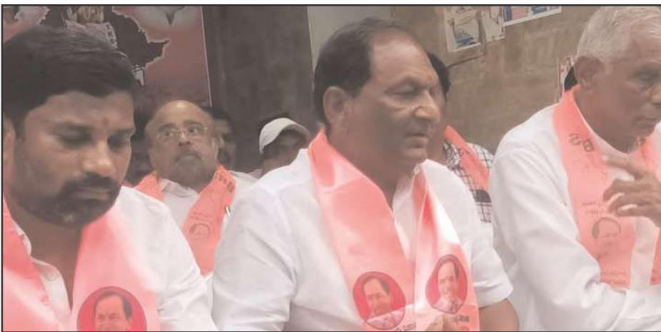
ఆదిలాబాదు ఉమ్మడి జిల్లా ప్రతినిధి, ఏప్రిల్ 08, సూర్య మేజర్ న్యూస్