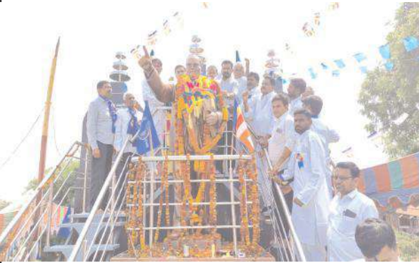
ఆదిలాబాద్ ఏప్రిల్ 10 సూర్య మేజర్ న్యూస్