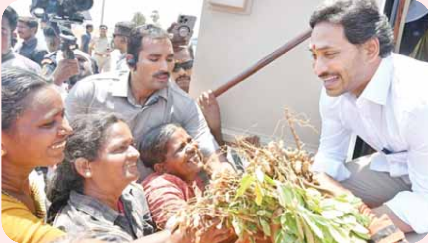
గంటలు ఆలస్యం గా వచ్చిన జగన్ను చూడటానికి వచ్చిన వేలాది ప్రజలు ఓపికతో నిరీక్షించారు.