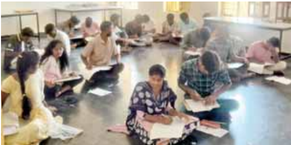
చూచి రాతలుగా సాగుతున్న ఓపెన్ ఇంటర్ ప్రాక్టికల్ పరీక్షలు

అనంతపురం విద్య, మేజర్ న్యూస్ : సారస్వతిక విద్యాపీఠం పరీక్షలు ఎప్పుడు ఓపెన్ గా జరుగుతాయన్న అపవాదు ఉండేది. అయితే శామ్మూల్ డీఈఈ గా పనిచేసిన సమయంలో ఓపెన్ ఇంటర్ పరీక్షల నిర్వహణను రెగ్యులర్ పరీక్షల నిర్వహణ అంత పటిష్టంగా నిర్వహించడంతో ఉత్తీర్ణత శాతం గణనీయంగా పడిపోయింది. ఈ క్రమంలోనే అనంతపురంలో జరగాల్సిన అడ్మిషన్లు కర్నూలు, కడప జిల్లాలకు తరలి వెళ్లాయని విద్యార్థులు అధికారులు బాహోటంగానే చెబుతుంటారు. ఓపెన్ పరీక్షలలో కాస్త కాపీలు జరగడం సహజమే అంటుంటారు. అయితే మరి అవి ఏ స్థాయిలో అన్నదే ఇప్పుడు ప్రశ్నార్థకంగా నిలుస్తున్నాయి. ఈ విధంగా చూచిరాత పర్యానికి తెరదీస్తూ కోఆర్డినేటర్లుగా చెప్పుకునే కొందరు వసూళ్ల పర్యాన్ని పరుగులెత్తించారు. ప్రభుత్వ నిర్ణీత రుసుము ప్రకారం రూ. 3,000 చెల్లించాల్సి ఉంటుంది. అయితే ఒక్కో విద్యార్థి నుండి రూ. 12 వేల నుండి రూ. 18 వేల వరకు వసూళ్లు చేశారని తెలిసింది. ఇక హోల్ టీకెట్ కు అదనంగా 1000 రూపాయలు. ఇక్కడితో ఈ వసూళ్ల దండా ఆగిందా అంటే అది లేదు. ఇంటర్ ప్రాక్టికల్ పరీక్షలలో కూడా