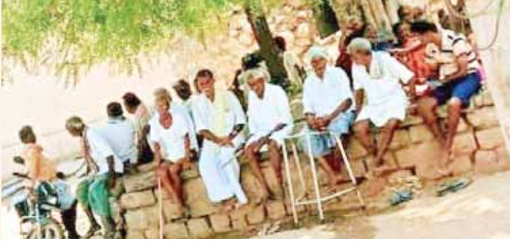
కమ్మూరులో పెన్షన్ కోసం పడిగాపులు కాస్తున్న పెన్షన్ దారులు...

లబ్ధిదారులు ఎగబ డారు, ఉదయం నుండి మధ్యాహ్నం వరకు గంటల కొద్ది ప్రజలు ఎదురు చూశారు, ఈ సందర్భంగా పింఛన్దారులు మాట్లాడుకుంటూ ముఖ్యమంత్రి జగన్మోహన్ రెడ్డి ఉదయమే వాలంటీర్ల ద్వారా మా ఇంటి తలుపులు తట్టి లేపి మరీ పెన్షన్ ఇచ్చి పోయే వారిని, ఇదేమి దౌర్భాగ్యం ఎర్రటి ఎండలో పెన్షన్ కోసం కాచుకోవాల్సిన దౌర్భాగ్య పరిస్థితి ఏర్పడిందని పెన్షన్ దారులు వాపోతున్నారు, సచివాలయం దగ్గర త్రాగడానికి నీరు కూడా అధికారులు ఏర్పాటు చేయలేదని ప్రజల ఆవేదన చెందుతున్నట్టు తెలిసింది,, అలాగే వైయస్సార్ పార్టీ మండల ప్రజా ప్రతినిధులు ఈ సందర్భం గా మాట్లాడుతూ 1వ తేదీ వచ్చిందంటే