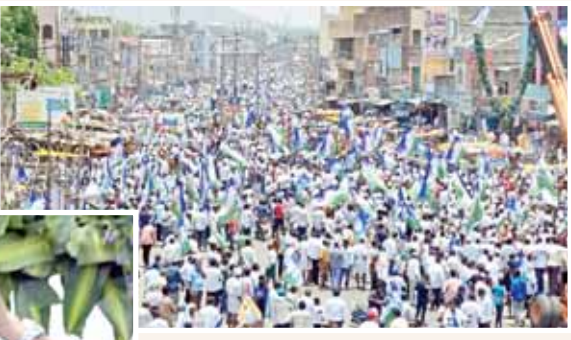
ప్రజాప్ర తినిధులు పెద్ద ఎత్తున పాల్గొన్న వారిలో ఉన్నారు.