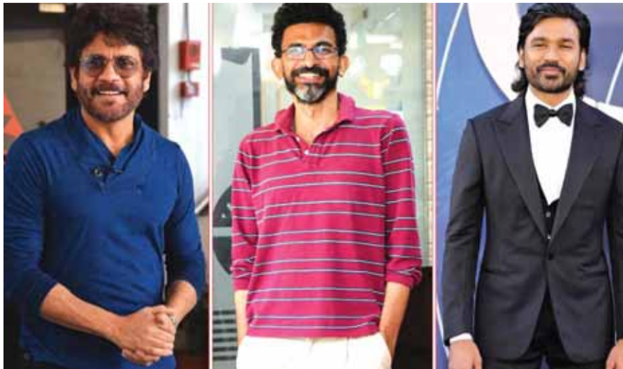
విదాది వస్తున్న పాన్ ఇండియా చిత్రాలలో హై బడ్జెట్లో రూపొందిన సినిమాల్లో కుబేర ఒకటి.