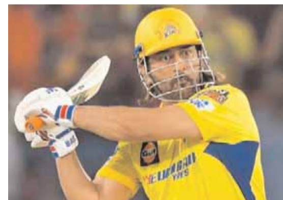
పరుగుల కట్టి చేస్తూ ఆడిలోనే సర్రజెర్స్ వికెట్ల తీయాలని షాన్ చేస్తోంది. దాని కోసం తుదిజట్టులో భారీ మార్పులు చేయాలనుకుంటుంది. వికెట్ స్ట్రాక్

గత సీజన్లో సర్రజెర్స్ హైదరాబాద్ మ్యాచ్ అంటే ప్రత్యక్ష జట్టు ప్రత్యేకంగా ప్రణాళికరేపి రచించలేదు. నెట్ రేట్లు ఎంతవేర సరిపెరిచుకోవచ్చునే ఆలోచనలోనే బరిలోకి దిగారు. కానీ ఐపీఎల్-2024లో అంటే ప్రత్యక్ష వెస్టర్లలో చణుకు వుండోంది. విజయం గురించి ఆలోచించకుండా పరువు పోకుంటే చాలు అనే రీతిలో ఇతర జట్లు భావించే పరిస్థితి తలెత్తింది. ఎస్ఆర్ఆర్ ఇన్ఫింగ్స్ ప్రత్యక్ష బౌలర్ ఓవర్లు 12 పరుగులు ఇస్తే, అతడు ఓవర్లుగా బౌలింగ్ చేశాడనే మెచ్చు కునే పరిస్థితి వచ్చింది. హైదరాబాద్ బ్యాటింగ్ ఓవర్ల కనీసం పది పరుగులు కావడం కాకుండా మారింది. అంతలా ముందు టీమ్ వెలతేగోతోంది. ఆర్పీబీ 11 ఏకైక 262 స్కోరు రికార్డును రోజుల వ్యవధిలోనే సర్రజెర్స్ ఏకంగా మూడు సార్లు బ్రేక్ చేసింది. టాప్ స్కోరర్ జట్టుగా పేరు ఉన్న ఆర్పీబీపైనే 287 పరుగుల రికార్డు స్కోరు చేసింది. బలమైన ముందై ఇండియన్లు (277 రన్స్) కూడా ఎస్ఆర్ఆర్ పదిలిపెట్టారు. గత మ్యాచ్లో ఢిల్లీ క్యాపిటల్స్ (266 పరుగులు) విరుచుకు పడింది. దీంతో హైదరాబాద్ జట్టులో అదివారం చెపాక్ వేదికగా జరగనున్న మ్యాచ్ వెస్టె సూపర్ కింగ్స్ ఇప్పటి ప్రణాళికల రచించడం మొదలుపెట్టింది. రికార్డులు సమర్పించుకోకుండా బ్యాట్లకు కంట్లో చేయాలని చూస్తోంది.