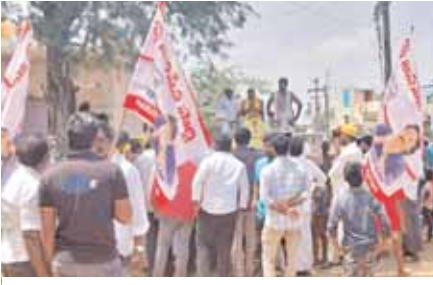
ప్రచారం నిర్వహిస్తున్న దృశ్యం

దొరవారిసత్రం మేజర్ న్యూస్ :- దొరవారిసత్రం మండలంలో భారతీయ జనతా పార్టీ నాయకులు ఉన్నారా? ఉండి లేనట్లుగా వ్యవహరిస్తున్నారా? ఎన్నికల ప్రచారంలో బిజెపి నాయకులు ఎందుకు పాల్గొనడం లేదని విమర్శలు విరివిగా ఉన్నాయి. వైసీపీ, ఉమ్మడి పార్టీల అభ్యర్థి పోటీ పోటీగా ప్రచారాలు సాగిస్తుంటే, బిజెపి జనసేన, పార్టీల పొత్తుతో తెలుగుదేశం పార్టీ అభ్యర్థిని విజయశ్రీ దొరవారిసత్రం మండలంలో విస్తృతంగా