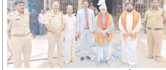
స్వామివారిని దర్శించుకున్న సుప్రీంకోర్టు జడ్జి