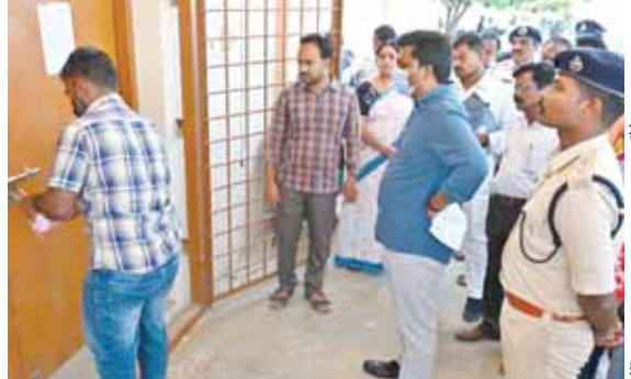
ఈవీఎం రూములను పరిశీలిస్తున్న కలెక్టర్ షన్షేహాన్

జిల్లా కలెక్టర్ జిల్లా ఎన్నికల అధికారి సగిలి షన్షేహాన్ చిత్తూరు కలెక్టరేట్, మేజర్ న్యూస్ ఈవీఎంల ర్యాండ్ మైజేషన్ కోసం పటిష్టమైన ఏర్పాట్లను చేపట్టాలని జిల్లా కలెక్టర్ జిల్లా ఎన్నికల అధికారి ఎస్. షన్షేహాన్ ఆదేశించారు. బుధవారం కలెక్టరేట్ లోని ఈవీఎం గోడౌన్ ను ఈవీఎంల ర్యాండ్ మైజేషన్ నిమిత్తం చేపట్టవలసిన ఏర్పాట్లపై జిల్లా ఎస్పీ మణికుంఠ, రాజకీయ పార్టీల ప్రతినిధులతో కలిసి జిల్లా కలెక్టర్ తనిఖీ చేశారు. ఈ సందర్భంగా భద్రతా చర్యలను జిల్లా కలెక్టర్ క్షుణ్ణంగా పరిశీలన చేశారు. ఈవీఎం గోడౌన్ వద్ద పటిష్ట బందోబస్తు నిత్యం కొనసాగాలని అధికారులను జిల్లా కలెక్టర్ ఆదేశించారు. ఈనెల 12వ తేదీ నుంచి చేపట్టే ఈవీఎంల ర్యాండ్ మైజేషన్ మిగతా 2 లో