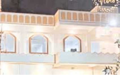
రంజాన్ కు ముస్తాబైన మసీదు