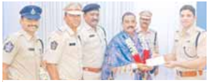
హెంగార్డుకు చెక్ను అందజేస్తున్న ఎస్పీ

అర్ధిక చేయూతనిచ్చి ఐక్యత చాటిన హెంగార్డులు 5లక్షల చెక్కును అందజేసిన జిల్లా ఎస్పీ