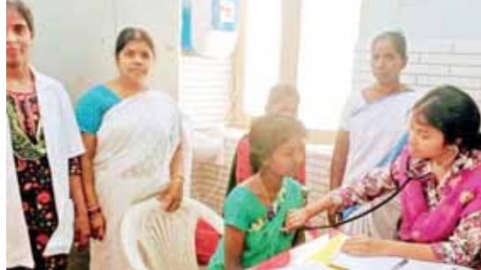
సూచించారు. గర్భవతులు తినే ఆహారంలో సజ్జలు రాగులు, కొర్రలు లాంటి చిరుధాన్యాలను తినడం భోజనం తర్వాత ఐఎఫ్వి టాబ్లెట్ కచ్చితంగా వేసుకోవడం చేయాలని సూచించినట్లు ఆమె తెలిపారు. అనంతరం వైద్య పరీక్షలను నిర్వహించారు. వైద్య సిబ్బంది పాల్గొన్నారు.