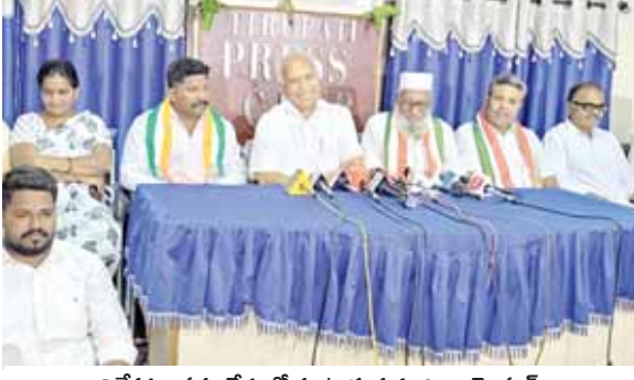
విలేకరుల సమావేశంలో మాట్లాడుతున్న చింతామోహన్

150 సీట్లతో బిజెపి పతనం ఖాయం... కేంద్రంలో కాంగ్రెస్ సంకీర్ణ ప్రభుత్వం ఏర్పాటు మాజీ కేంద్రమంత్రి చింతామోహన్ వెల్లడి