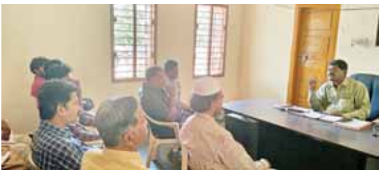
అధికారులకు సూచనలు ఇస్తున్న ఎంపీడీవో