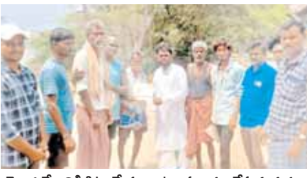
తెలుగుదేశానికి ఓటు వేయాలంటూ ప్రచారం చేస్తున్న దృశ్యం