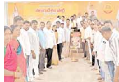
కుప్పం, మేజర్ న్యూస్: కుప్పం నియోజకవర్గ బీసీ సెల్ అధ్యక్షులలో మహాత్మ జ్యోతిరావు పూలే 197వ జయంతి వేడుకలను కుప్పం తెలుగుదేశం