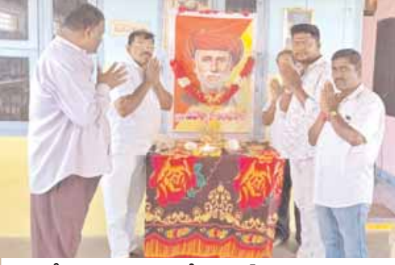
పూలే జయంతి కార్యక్రమంలో ముదిరాజ్ సంఘం నాయకులు