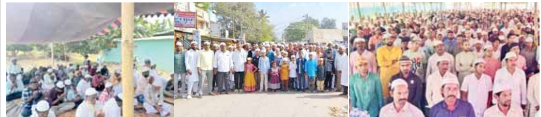
వెదురుకుప్పంలో ప్రార్థన చేస్తున్న ముస్లింలు, పెనుమూరులో ఈడ్లా వద్దకు ర్యాలీగా వెళ్తున్న ముస్లింలు, నాయుడుపేటలో పాఠశాల చేస్తున్న ముస్లింలు

చౌడపల్లిలో... చౌడపల్లి, మేజర్ న్యూస్: చౌడపల్లి మండల వ్యాప్తంగా ముస్లింలు ఈద్-ఉల్-ఫితర్ రంజాన్ పండుగను భక్తిశ్రద్ధలతో ఘనంగా జరుపు