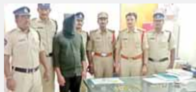
నిందితుడు అరెస్టు మాపుతున్న రూరల్ పోలీస్ స్టేషన్ పోలీసులు

- రూ.2 లక్షల విలువజేసే సొత్తు స్వాధీనం : సీబి తమీమ్ అహ్మద్