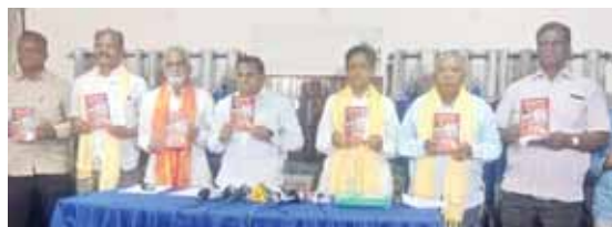
భగవద్గీత వంచి శ్లోకాల భావాలతో కూడిన పుస్తకాన్ని ఆవిష్కరిస్తున్న ప్రతినిధులు