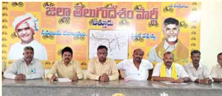
సమావేశంలో మాట్లాడుతున్న టీడీపీ నాయకులు