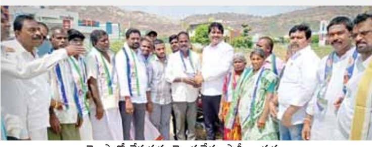
వైకాపాలో చేరుతున్న తెలుగుదేశం పార్టీ నాయకులు