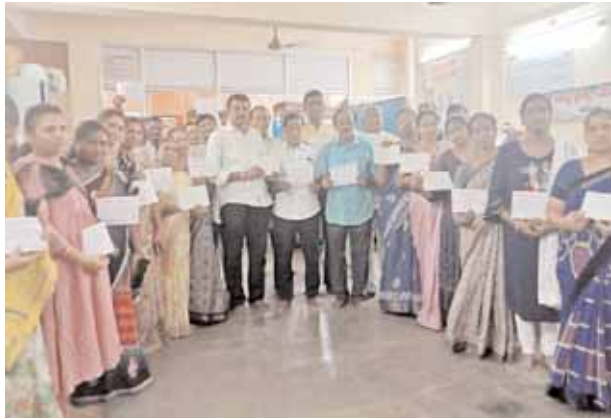
తిరుపతి ఎడ్యుకేషన్ మేజర్ న్యూస్ ... ఓటు అనేది ప్రతి పౌరుడి ప్రాథమిక హక్కు అని, రాజ్యాంగం కల్పించిన ఓటును ఆర్యవైశ్యలందరకు..