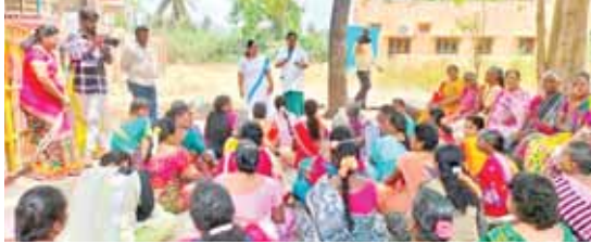
ప్రజలకు అవగాహన కల్పిస్తున్న ఆరోగ్యశాఖ సిబ్బంది

చిత్తూరు కార్పొరేషన్, మేజర్స్ న్యూస్: వేసవి ఎండల తీవ్రత ఎక్కువగా ఉన్న నేపథ్యంలో నగర పాలక సంస్థ పరిధిలో వడదెబ్బ పై అవగాహన కార్యక్రమాలు నిర్వహిస్తున్నారు. కలెక్టర్ ఆదేశాల మేరకు కమిషనర్ డా. జె అరుణ మార్గనిర్దేశంతో నగరపాలక పరిధిలోని అన్ని వార్డుల్లో వార్డు ఆరోగ్య కార్యదర్శుల ఆధ్వర్యంలో వడదెబ్బ, లక్షణాలు, తీసుకోవాల్సిన జాగ్రత్తలపై అవగాహన కార్యక్రమాలు నిర్వహించారు. ఎండల తీవ్రత అధికంగా ఉన్న దృష్ట్యా ప్రజలు తగిన జాగ్రత్తలు తీసుకోవాలని ఏఎన్ఎంలు సూచించారు. ప్రధానంగా మధ్యాహ్నం 11 గంటల నుంచి సాయంత్రం నాలుగు గంటల వరకు ఎండలో ఆరు బయట పనులు చేయరాదన్నారు. వృద్ధులు, మహిళలు, పిల్లలు పగటి సమయం వీలైనంతవరకు ఇళ్లలోనే ఉండాలని, నీరు ఎక్కువగా తాగాలని, పనులు చేసేవారు నీడలో చేసేలా ఏర్పాట్లు చేసుకోవాలన్నారు.