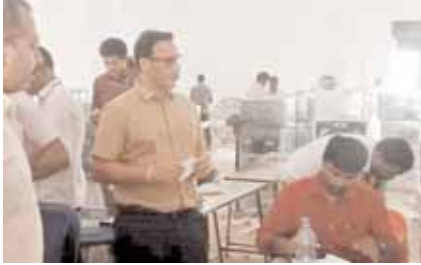
ఈవిఎం గోడౌన్ ను పరిశీలిస్తున్న కలెక్టర్