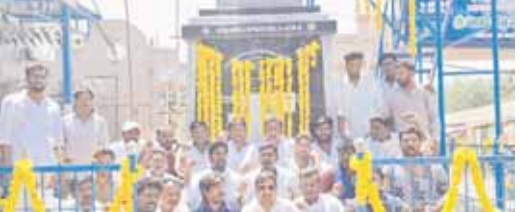
నివాళులు అర్పిస్తున్న దృశ్యం