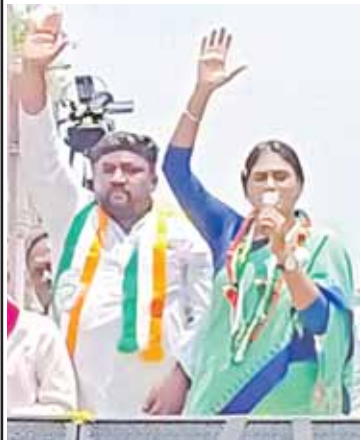
మాట్లాడుతున్న వైఎస్ షర్మిలారెడ్డి