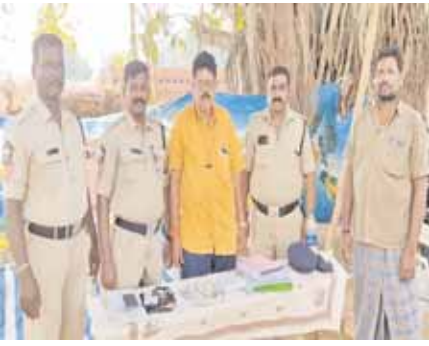
స్వాధీనం చేసుకున్న నగదుతో పోలీస్ సిబ్బంది