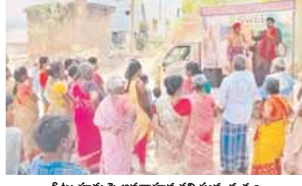
ఓటు హక్కుపై అవగాహన కల్పిస్తున్న దృశ్యం