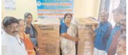
వస్తువులు రూపంలో విరాళాన్ని అందచేస్తున్న దృశ్యం