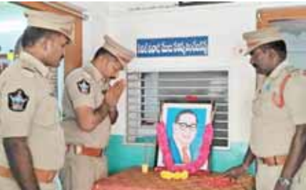
డా.బి.ఆర్. అంబేద్కర్ ను నివాళులు అర్పిస్తున్న ఎస్సీ