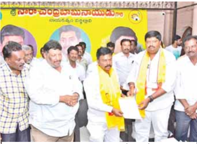
వన్నె కుల క్షత్రియులకు హామీ పత్రం అందజేస్తున్న జిజే యం.

కమ్యూనిటీ భవనం, వృద్ధాశ్రమం, సత్రాల నిర్మాణానికి భూమి విరాళంగా అందజేస్తూ...గురజాల జగన్నాథాచార్యులు