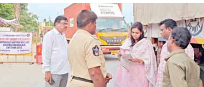
ఆంధ్ర తమిళనాడు సరిహద్దుల్లో ఆకస్మిక తనిఖీలు చేస్తున్న ఏఆర్ఎస్ అరుణ

ఏఆర్ఎస్, ఎంసీసీ నోడల్ అధికారి, కమిషనర్ డా. జె అరుణ