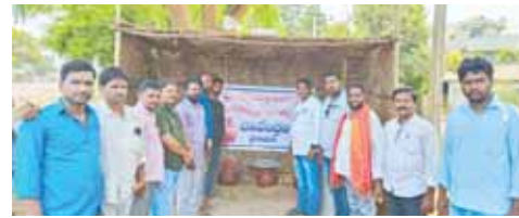
చలివేంద్రం ప్రారంభిస్తున్న శ్రీకాళహస్తి ప్రెస్ క్లబ్ సభ్యులు

శ్రీకాళహస్తి, మేజర్ న్యూస్: స్థానిక హౌసింగ్ బోర్డ్ కాలనీ వద్ద శ్రీకాళహస్తి ప్రెస్ క్లబ్, ప్రజాధ్యయం దినపత్రిక ఆధ్వర్యంలో బుధవారం చలివేంద్రాన్ని ప్రారంభించారు.