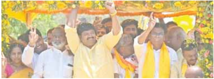
నామినేషన్ ప్రక్రియకు ర్యాలీగా తరలి వెళ్తున్న చిత్తూరు ఎంపీ దగ్గుమల్ల ప్రసాదరావు చిత్తూరు నియోజకవర్గ ఎమ్మెల్యే అభ్యర్థి గురజాల జగన్ మోహన్.