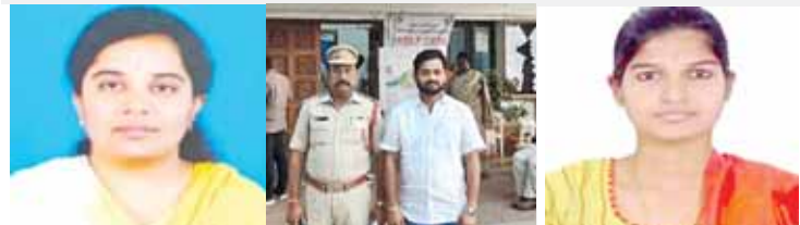
ఎం.సి.పి 2వ సెమిస్టర్ ఫలితాలలో ఉత్తమ ప్రతిభ కనబరిచిన విజయం బిజినెస్ స్కూల్ విద్యార్థులు