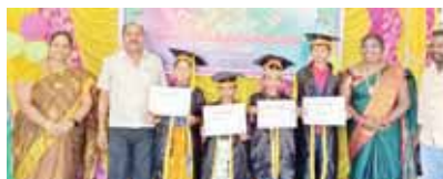
విద్యార్థులు గ్రాడ్యుషన్ కోటు వేసి, సర్టిఫికేట్లు అందజేస్తున్న దృశ్యం

తిరుపతి ఎడ్యుకేషన్ మేజర్ న్యూస్: రూరల్ మండలంలోని నాగూరు కాలనీలోని మండల పరిషత్ ప్రాథమిక పాఠశాల (ఎంపిపి స్కూల్) వార్షికోత్సవాన్ని బుధవారం ఘనంగా నిర్వహించారు. ప్రయివేట్ పాఠశాలకు దీటుగా విద్యార్థులు గ్రాడ్యుషన్ కోటు వేసి, సర్టిఫికేట్లు అందజేశారు. ఈ సందర్భంగా పలు