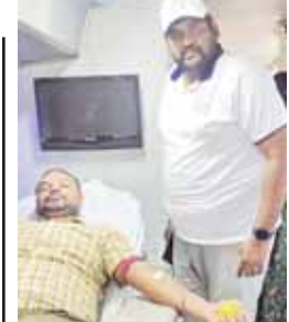
రక్తదానం ఇస్తున్న ఆర్డీవో శ్రీకాళహస్తి మున్సిపాలిటీ కమిషనర్