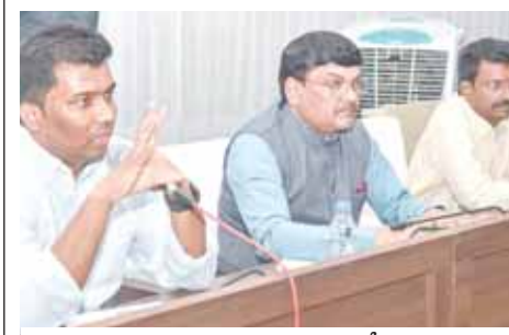
అధికారులకు దిశా నిరశం చేస్తున్న కలెక్టర్, జిల్లా ఎన్నికల అధికారి సగిలి షన్మోహన్

- వృద్ధుల పట్ల పూర్తి అవగాహన కలిగి ఉండాలి.. కలెక్టర్, జిల్లా ఎన్నికల అధికారి సగిలి షన్మోహన్