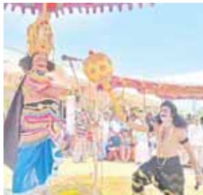
దుర్భేధనుడు, భీముడు వేషణదారులు తల పడుతున్న దృశ్యం

వెదురుకుప్పం, మేజర్ స్టూన్స్: మండలంలోని తిరుమలయ్య వల్లి పంచాయతీ మొరవ మహాభారతం ఉత్సవాల్లో భాగంగా ఆదివారం దుర్భేధన వద కార్యక్రమం అత్యంత వైభవంగా జరిగింది. గంగమడుగులో దాగివున్న దుర్భేధనుని భీముడు లాక్కొని వచ్చిన సన్నివేశం పలు వురుని ఆకట్టుకుంది. దుర్భేధన వద కార్యక్రమంలో దుర్భేధనుని ప్రతిమను అలంకరించారు. భీముడి వేషధారుడు దుర్భేధనుని లాక్కొని వచ్చి దుర్భేధనుని ప్రతిమ వద్ద నిలబెట్టారు. భీముడు, దుర్భేధనుడు తలపడే దృశ్యాలు కళ్లకు కట్టినట్లు కనబడడంతో పలువురు ఆ ఘట్టాన్ని తిలకించి పులకరించిపోయారు. దుర్భేధనుని వద ఆనంతరం దుర్భేధనుని ప్రతిమ వద్ద ఉన్న మట్టి కొసం జనం ఎగబడ్డారు. మట్టిని తమ ఇళ్లకోసం దాచుకుంటే అష్ట ఐశ్వర్యాలు కలుగుతాయి అన్న నమ్మకంతో మట్టిని తీసుకెళ్లారు. ఆలయ కార్యనిర్వాహకులు ఏర్పాట్లను పర్యవేక్షించారు.