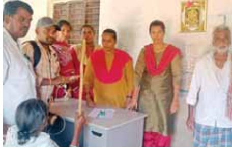
ఫిన్లెక్స్ అందచేస్తున్న దృశ్యం