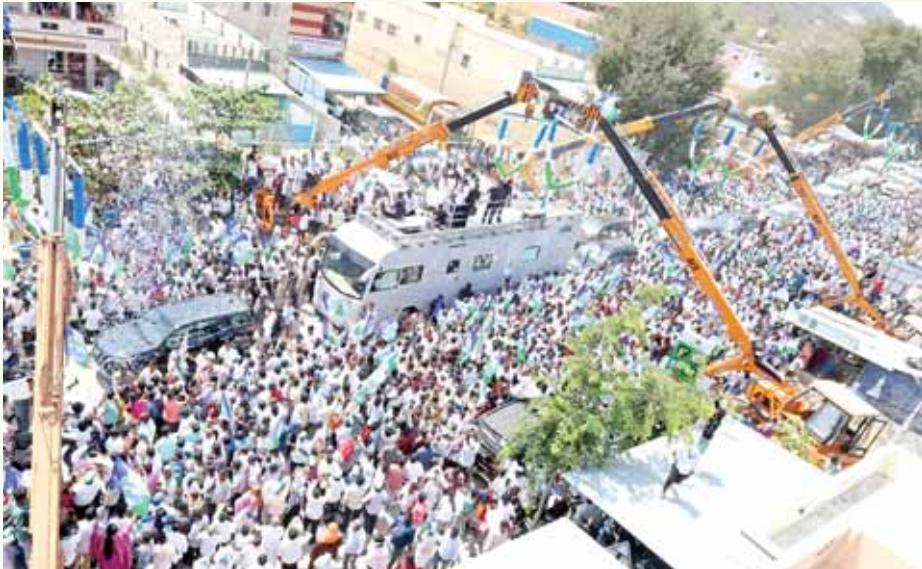
కూడలికి చేరుకోక ముందే అశేషంగా తరలివచ్చిన ప్రజా సీకాన్ని చూసిన సీఎం జగన్ బస్సు పైకి ఎక్కి ప్రజలకు అభివాదం చేశారు. సీఎం జగన్ తో పాటు చంద్రగిరి