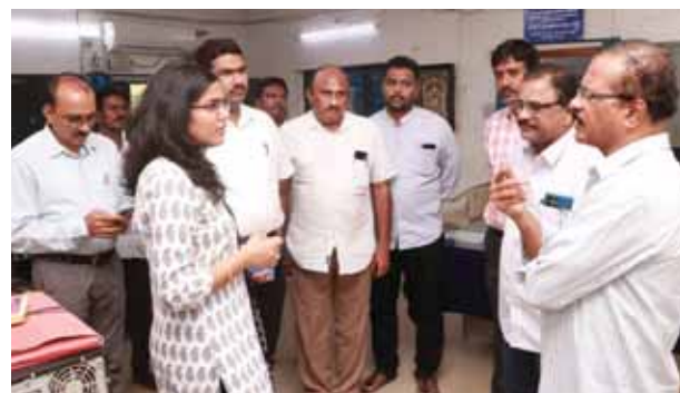
అధికారులకు సూచనలు ఇస్తున్న అతిథిసింగ్