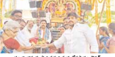
నల్ల గంగమ్మకు సారె సమర్పిస్తున్న దేవస్థానం చైర్మన్

శ్రీకాళహస్తి, మేజర్ న్యూస్: శ్రీకాళహస్తి పట్టణం బహదూర్ పేటలో వెలసిన శ్రీ శ్రీ నల్ల గంగమ్మ అమ్మవారు జాతర సం