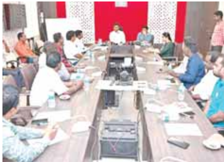
మాట్లాడుతున్న జిల్లా కలెక్టర్ సగిలి ఎస్.షణ్షోహాన్

సచివాలయాలలో పెన్షన్లు పంపిణీ... జిల్లా వ్యాప్తంగా 2,74,553 మందికి పెన్షన్ల పంపిణీ జిల్లా కలెక్టర్ సగిలి షణ్షోహాన్