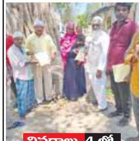
వివరాలు 4 లో