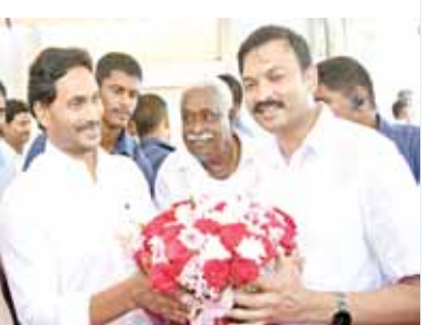
సీఎంసీ పుష్పగుచ్ఛాన్ని అందచేస్తున్న దృశ్యం