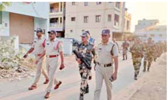
కల్పించారు. ఈ కార్యక్రమంలో అలిపిరి ఎస్సెలు, పోలీస్ స్టేషన్ సిబ్బంది, బిఎస్ఎఫ్ బలగాలు పాల్గొన్నారు.