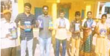
ప్రచారం నిర్వహిస్తున్న దృశ్యం

గుడిపల్లి, మేజర్ న్యూస్: తెలుగు కొత్త సంవత్సరం ప్రాంభం ను పురస్కరించుకుని ఆదివారం నాడు మండలంలోని బిగ్గిపల్లి గ్రామంలో త్రైత సిద్ధాంతం-ప్రబోధ సేవా