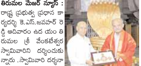
తిరుమల మేజర్ న్యూస్ :