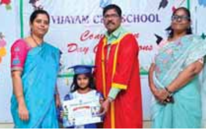
విద్యార్థిని బహుమతిని అందచేస్తున్న దృశ్యం