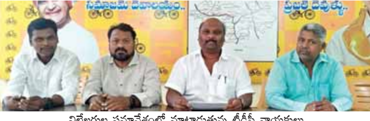
విలేఖరుల సమావేశంలో మాట్లాడుతున్న టీడీపీ నాయకులు

కుల్చి సంపూర్ణ పరచడానికి కానిస్టేబుల్స్ హెడ్ కానిస్టేబుల్స్ జీవితాలతో చెలగాటం మాడుతున్నారన్నారు. ఈ సందర్భంగా భారత ఎన్నికల కమిషన్ కి టీడీపీ నాయకులు లేఖలు రాశారు. ఈ కార్యక్రమంలో