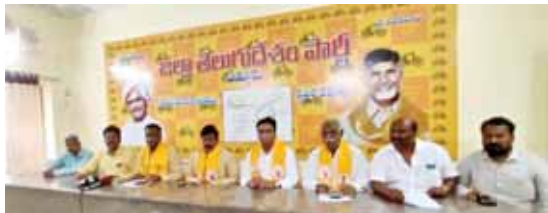
సమావేశంలో మాట్లాడుతున్న నాయకులు