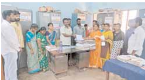
రాజీనామా పత్రాలను అందచేస్తున్న వలంటీర్లు

దొరవారిసత్రం మేజర్ న్యూస్: వైయస్ జగన్మోహన్ రెడ్డి ముఖ్యమంత్రి పాలనలో ప్రధానపాత్ర పోషిస్తున్న వలంటీర్లు రాజీనామాకు నిర్ణయించారు. తిరుపతి జిల్లా దొరవారిసత్రం మండల ఏ రిధిలోని ఏకొల్లు గ్రామపంచాయతీ వార్డు వలంటీర్లుగా ఏర్పాటు నిర్వహించిన 16 గురు వలంటీర్లు అందరూ సోమ వారం స్వచ్ఛందంగా రాజీనామా పత్రాల్ని సూపరించెందెంట్