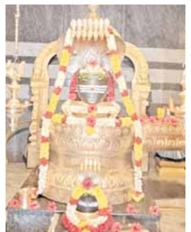
ప్రత్యేక అలంకరణలో కొండమల్లేశ్వర స్వామి

కాండమల్లేశ్వర స్వామికి పాలాభిషేకం వెదురుకుప్పం, మేజర్ న్యూస్: డిఆర్ అండ్ కండ్రీగ్ గ్రామ సమీపంలో అరుణ గిరి క్షేత్రంలో వెలసి ఉన్న శ్రీ జ్ఞాన ప్రసానాంబ సమేత శ్రీ కొండ మల్లేశ్వర స్వామి ఆలయంలో సోమవారం పాలాభిషేకం వైభవంగా జరిగింది. స్వామివారికి పాలాభిషేకం అనంతరం ప్రత్యేక పూజాది కార్యక్రమాలు నిర్వహించారు. భక్తులు అధిక సంఖ్యలో స్వామివారిని దర్శించుకున్నారు. భక్తులకు కార్యనిర్వహకులు తీర్థ ప్రసాదాలను అందజేశారు