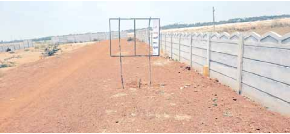
హెచ్చరిక బోర్డులు తొలగిస్తాం