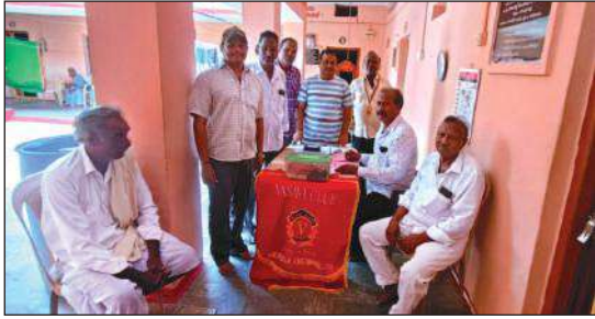
మాచర్ల మేజర్ న్యూస్: నంద్యాల శాంతిరాం మెడికల్ కాలేజీ వారి సహకారంతో మాచర్ల వాసవి

నంద్యాల శాంతిరాం వైద్యశాలకు రిఫర్ చేశారు. ఈ