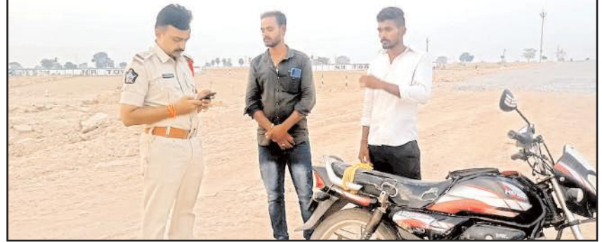
ప్రమాదాలు జరిగినాక బాధపడకుండా, ప్రతి నడిపి తమ ప్రాణాలతో పాటు ఎదుటివారి ఒక్కరూ ట్రాఫిక్ రూల్స్ ప్రచారం వాహనాలను ప్రాణాలను కాపాడాలి అన్నారు.