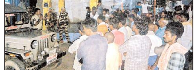
మాచర్ల, మేజర్ న్యూస్