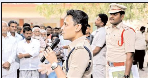
మాచర్ల, మేజర్ న్యూస్

మాచర్ల మండలంలోని సమస్యాత్మక గ్రామాలైన గన్నవరం, మతుకుమల్లి, కంభంపాడు, రాయవరం, జమ్మలమడుగు గ్రామాలలో గల పోలింగ్ కేంద్రాలను శ్రీ ఎస్పీ గారు సందర్శించి అక్కడ భద్రతా ఏర్పాటు పరిశీలించి పోలీసు అధికారులకు తగు సూచనలు ఇచ్చారు. అదేవిధంగా అక్కడ ప్రజలతో మాట్లాడారు, గతంలో అక్కడ జరిగిన వివిధ సంఘటనల గురించి అడిగి తెలుసుకున్నారు. ప్రజలకు ఓటు హక్కు విలువలను గురించి వివరించారు. స్వేచ్ఛగా ఓటు హక్కు వినియోగించుకోవాలని సూచించారు. ఎన్నికల నియమావళి ఉల్లంఘనలపై 9440796184 నెంబరుకు కాల్ చేసి ఫిర్యాదు చేయాలని సూచించారు.