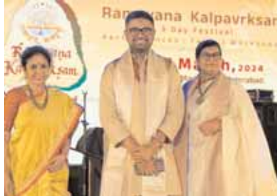
అయ్యర్ శ్రీలింగ్ సంగీతం ప్రేక్షకులను కట్టిపడేసింది. రిజాయిసింగ్ ఇన్ రఘు - బ్యాండ్

హైదరాబాద్, ఏప్రిల్ 2024: సంగీత, స్వావత్సవ హోమ్లలోని సీసీఆర్టీ క్యాంపస్లో ముగిసింది. ఈ ఉత్సవాలు కళా ప్రియుల మనస్సును దోచుకున్నాయనడంలో ఎటువంటి సందేహం లేదు. ఎందుకంటే, ఈ ఉత్సవాలకు దేశ వ్యాప్తంగా ఉన్న ప్రసిద్ధి చెందిన కళాకారులు తమ అద్భుత ప్రదర్శనలతో ప్రేక్షకులను మంత్ర ముగ్ధులను చేశారు. ఇందులో క్లాసికల్ నుంచి పాపులర్ వరకు ఎన్నో ప్రదర్శనలు ఇచ్చారు. ప్రదర్శనలతో పాటు చర్చలు, వర్క్ షాపులు, సంస్కృతావం, డిజిటల్ కళలు, వృత్తక అవిష్కరణలు జరిగాయి. చివరి రోజు కార్తిక