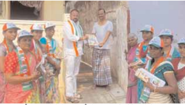
ఉండాలంటే చెయి గుర్తుకు ఓటు వేయాలని ఇంటింటికి తిరుగుతు ప్రజలను కోరారు. ఈ కార్యక్రమంలో నాయకులు, కార్యకర్తలు, మహిళలు పాల్గొన్నారు.