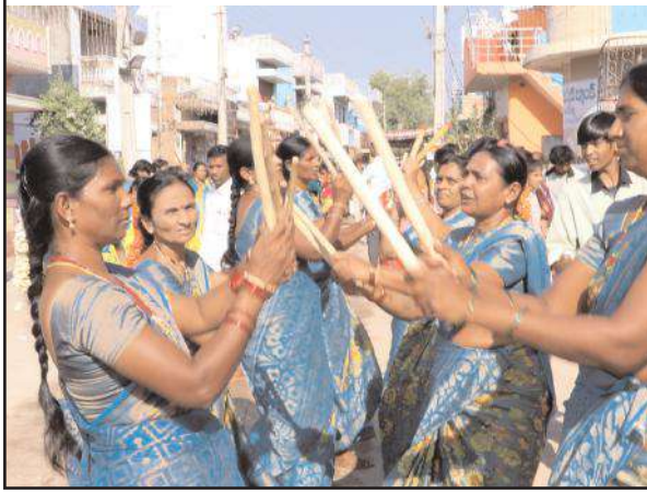
ఒంటిమిట్ట శ్రీరామనవమి బ్రహ్మోత్సవాల భాగంగా కోలాటం చేస్తున్న మహిళా భక్తులు