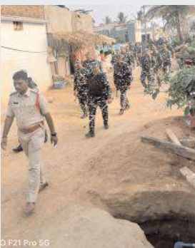
IFZ1 Pro 8G