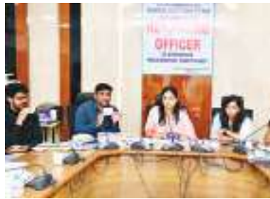
ఉపసంహరించు కున్నారని తెలిపారు. దీంతో కరింనగర్ పార్లమెంట్ స్థానం నుంచి పోటీ చేసేందుకు ప్రధాన పార్టీ అభ్యర్థులతో పాటు మొత్తం 28 మంది అభ్యర్థులు పోటీలో నిలిచారని జిల్లా కలెక్టర్ తెలిపారు.

పేర్కొన్నారు. 18వ తేదీ నుంచి 25వ తేదీ వరకు నామినేషన్ల ప్రక్రియ సాగిందని తెలిపారు. మొత్తం 53 మంది అభ్యర్థులు 94 నామినేషన్లను దాఖలు చేశారని చెప్పారు. ఇందులో శుక్రవారం జరిపిన నామినేషన్ల పరిశీలన ప్రక్రియలో 20 మంది అభ్యర్థుల వివరాలు, పత్రాలు సరిగా లేకపోవడంతో నామినేషన్లను తిరస్కరించామని పేర్కొన్నారు. 33 మంది అభ్యర్థుల్లో సోమవారం ఐదుగురు అభ్యర్థులు తమ నామినేషన్ పత్రాలను