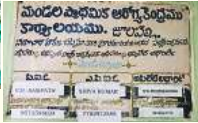
సహ చట్టం బోర్డులో అధికారుల పేర్లు మార్చు