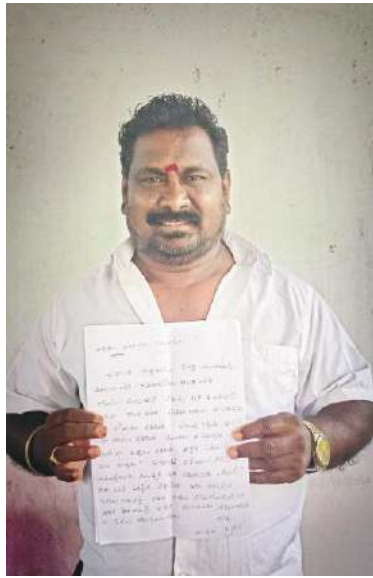
చెరువుగానే అనుకున్నాను. ఇలా చేస్తారని కలలలో అనుకోలేదు.