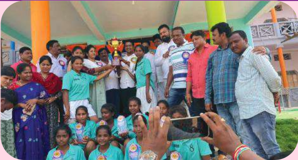
బోనకల్, సూర్య (మేజర్ న్యూస్):