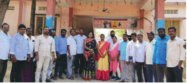
తీసుకురావాలని కోరారు. ఎండాకాలం దృష్టిలో ఉంచుకొని పిల్లలకి సాయంకాల సమయంలో మజ్జిగ లాంటి సౌకర్యాలు కల్పించాలని హాస్టల్ ఉపాధ్యాయులను కోరారు.హాస్టల్లోఎర్పాటు చేస్తున్న సౌకర్యాల గురించి పిల్లల్ని అడిగి తెలుసుకున్నారు. గురుకుల పాఠశాల సందర్శించిన అనంతరం ఉపాధ్యాయులతో కలిసి ముచ్చటించారు. విద్యార్థుల సౌకర్యాలు గురించి విషయాలు అడిగి తెలుసుకున్నారు. ఈ సమావేశంలో రాష్ట్ర, జిల్లా,కమిటీ నాయకులు పాల్గొన్నారు.