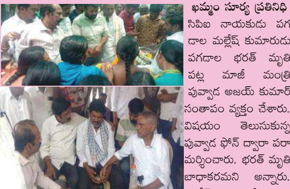
ఖమ్మం సూర్య ప్రతినిధి