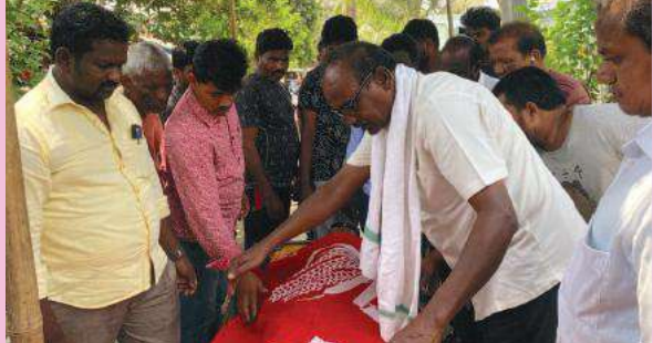
ఖమ్మం రూరల్ సూర్య మేజర్ స్యూస్